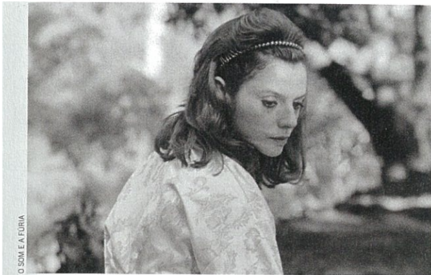
Tabou de Miguel Gomes (page 24).

Illustration de couverture: d'après une photo de L'Exercice de l'État de Pierre Schoeller