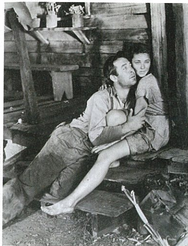
La Route du tabac de John Ford (page 68).