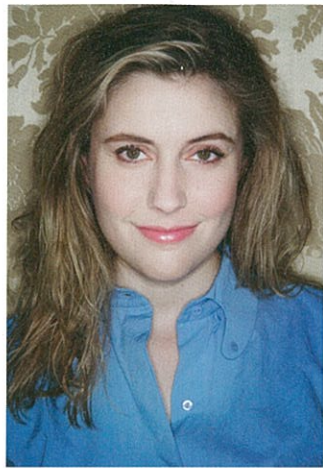
Greta Gerwig par Vincent Lignier pour les Cahiers du cinéma, Paris, juin 2013 (page 18).