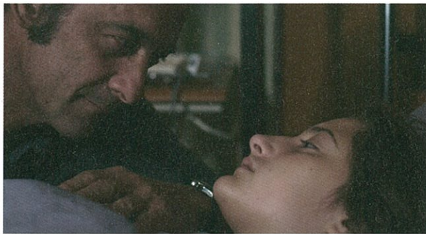
Les Salauds de Claire Denis (page 82).