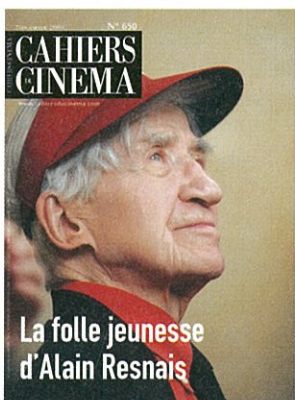
Alain Resnais en couverture des Cahiers : Hiroshima mon amour (n° 97, juillet 1959); L'Année dernière à Marienbad (n° 123, septembre 1961; photo: Georges Pierre); Muriel ou le Temps d'un retour (n° 174, septembre 1963); Mon oncle d'Amérique (n° 314, juillet-août 1980); Smoking / No Smoking (n° 474, décembre 1993; dessin: Floe'h); Les Herbes Folles (n° 650, novembre 2009; photo: Thierry Villetoux).