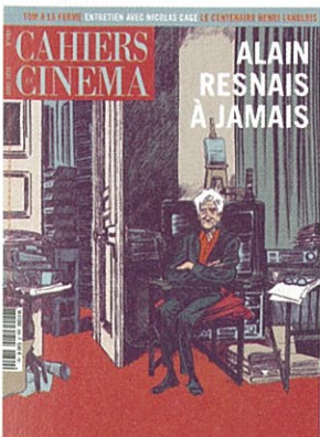
Couverture: Alain Resnais par Blutch pour les Cahiers du cinéma. Mise en couleurs Isabelle Merlet.