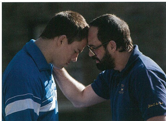
Foxcatcher de Bennett Miller (page 64).