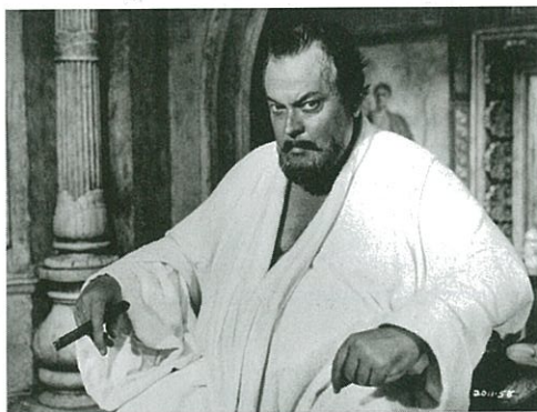
Orson Welles dans House of Cards de John Guillermin (page 74).