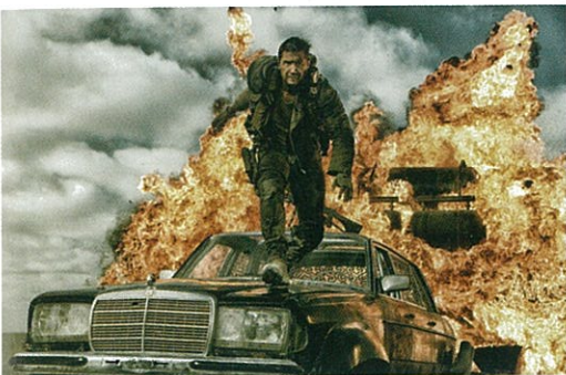
Mad Max: Fury Road de George Miller (page 36).