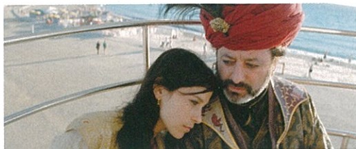
Les Mille et Une Nuits de Miguel Gomes (page 24).