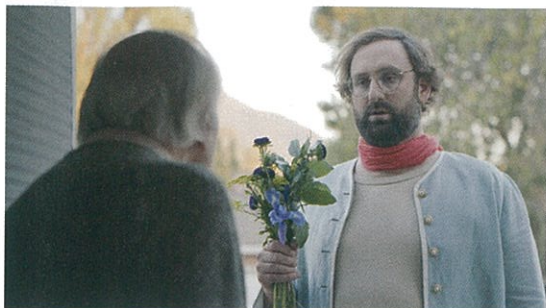
Réalité de Quentin Dupieux (page 6).

En couverture: Laetitia Dosch dans Jeune femme de Léonor Serraille.