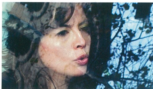
L'Académie des muses de José Luis Guerin (page 50).