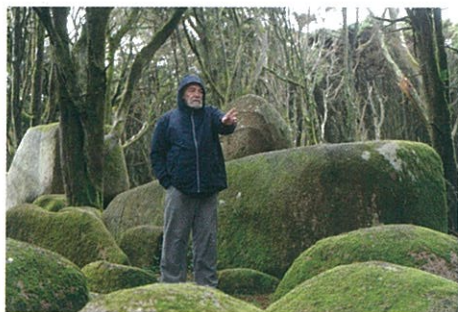
Andrzej Zulawski sur le tournage de Cosmos (page 84).