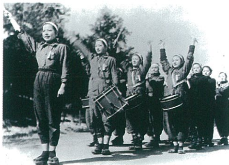
Le plus dignement d'Akira Kurosawa (page 76).