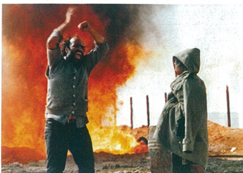
Amir Naderi sur le tournage du Coureur (page 86).