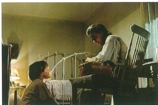
L'Autre de Robert Mulligan (page 88).