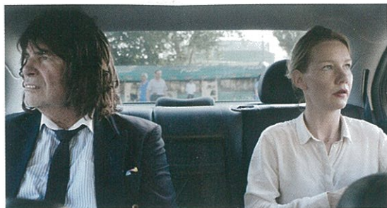
Toni Erdmann de Maren Ade (page 6).