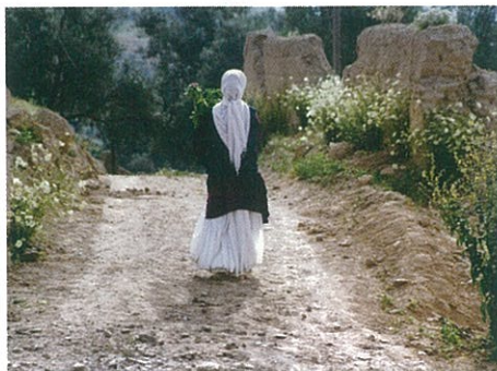
Au travers des oliviers d'Abbas Kiarostami (page 76).