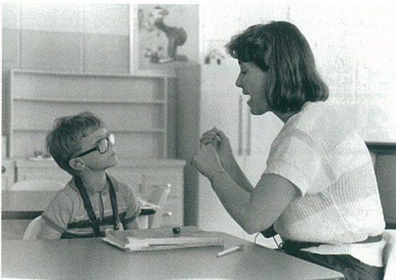
Deaf de Frederick Wiseman (page 80).