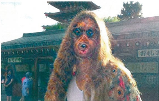
Rite of Passage de Cameron Lee, réalisé par Tyler Carberry (page 6).