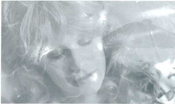
Leviathan de Flavian Berger, réalisé par Meriem Bennani (page 6).