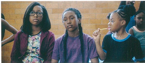
The Fits d'Anna Rose Holmer (page 30).