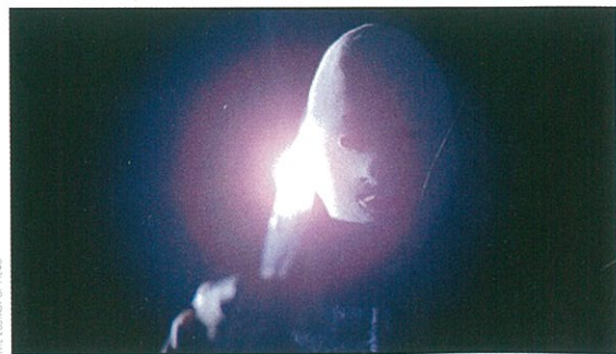
Torso de Sergio Martino (page 80).