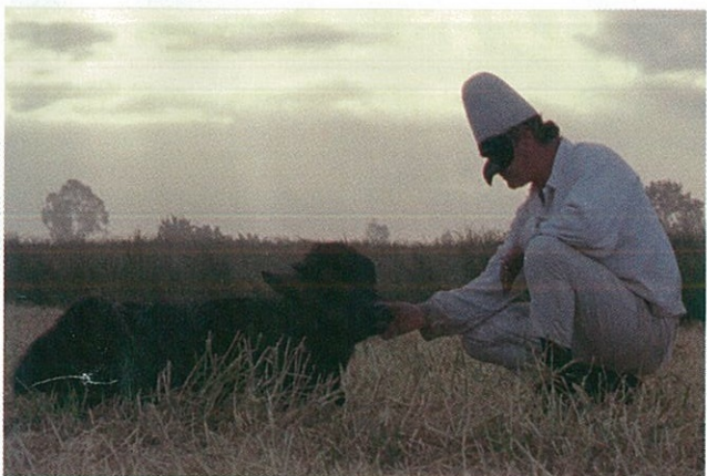
Bella e perduta de Pietro Marcello.