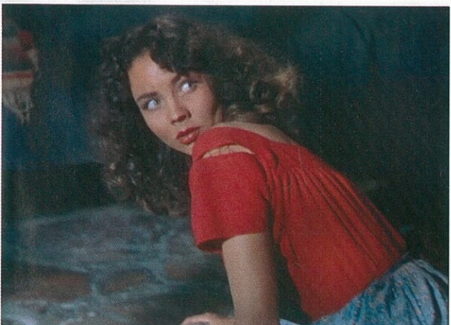
Duel au soleil de King Vidor.