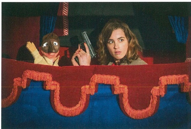
En liberté! de Pierre Salvadori.