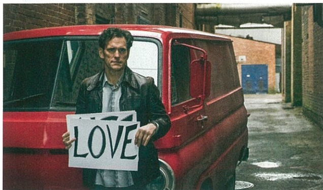
The House that Jack Built de Lars von Trier.

En couverture: The House that Jack Built de Lars von Trier.