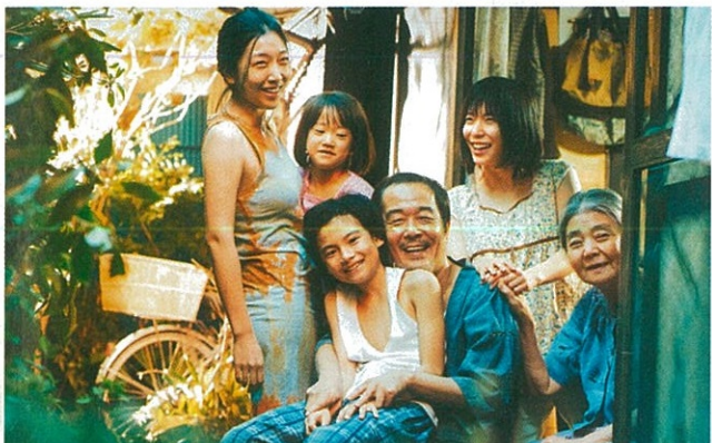
Une affaire de famille de Hirokazu Kore-eda.