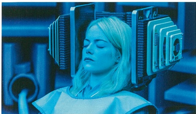
Maniac, saison 1.

Pour remercier nos abonnés de leur fidélité, ce numéro 750 est livré avec une brochure de dix pages comportant l'historique de toutes les couvertures des Cahiers du cinéma depuis le premier numéro d'avril 1951.