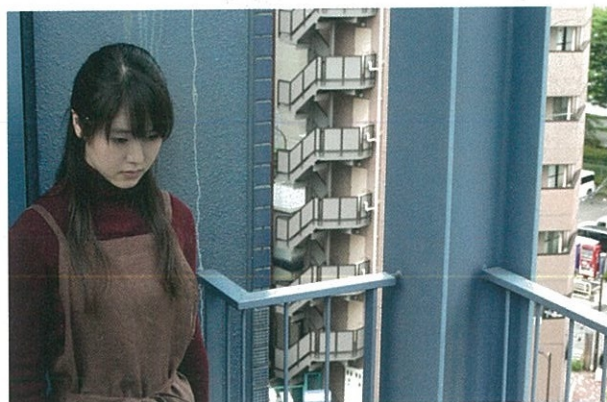
Asako I & II de Ryusuke Hamaguchi.