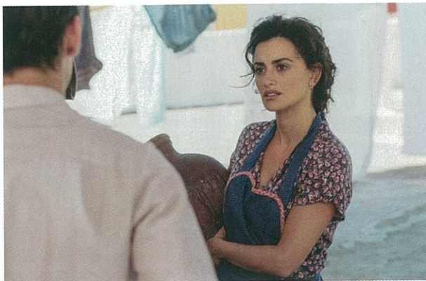
Dolor et Gloire de Pedro Almodóvar.