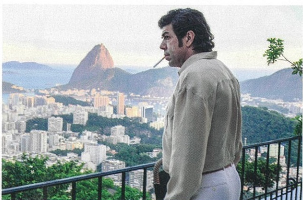
Le Traître de Marco Bellocchio.