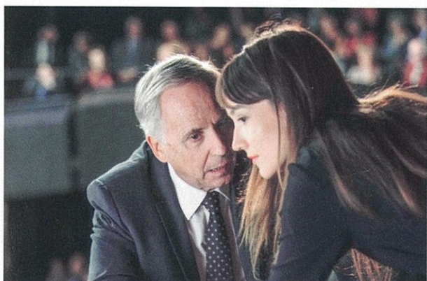
Alice et le Maire de Nicolas Pariser.