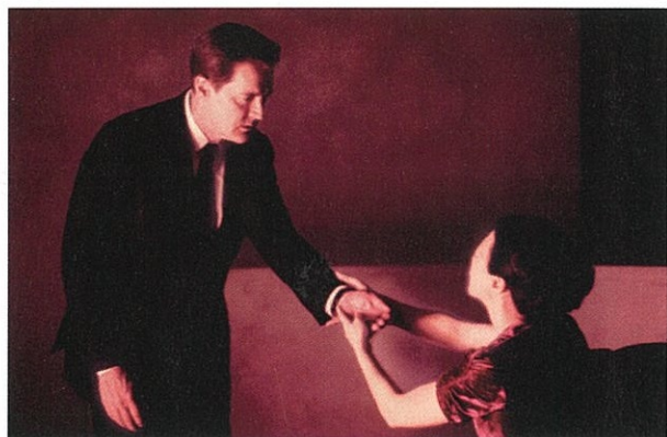
Twin Peaks: The Return de David Lynch.

Couverture, en partant du haut: Melancholia de Lars von Trier (© Zentropa Entert.) Twin Peaks: The Return de David Lynch (© Rancho Rosa Partnership, Inc.) Under the Skin de Jonathan Glazer (© Seventh Kingdom) Holy Motors de Leos Carax (© Pierre Grise Productions) P'tit Quinquin de Bruno Dumont (© Roger Arpajou/3B Productions)