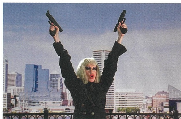
Cecil B. Demented de John Waters (2000).