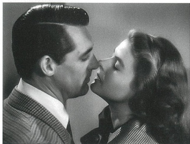
Les Enchaînés d'Alfred Hitchcock.